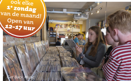
Get Back Music

Speciaal ook elke 1 e zondag van de maand! Open van 12-17 uur